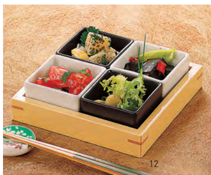
白木市松専用トレイ

19-230-12(27001) 1,500円 約14.3×14.3×H2.7cm / 内寸約12.6×12.6×H2cm ※陶器別売 ※陶器は下のプチ小鉢よりお選びください